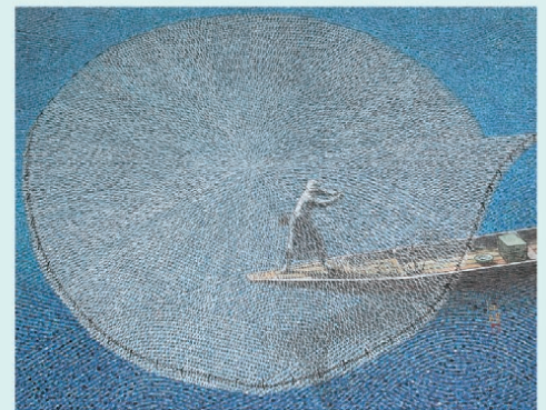
宮廻正明《天水》2012年 紙本彩色