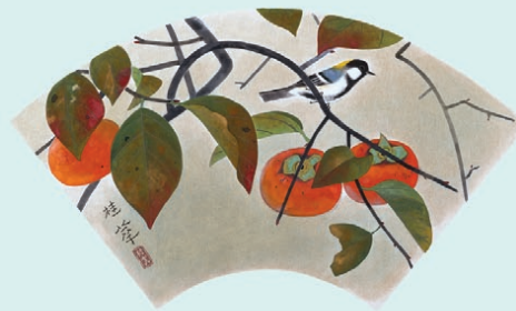
金島桂華《柿》1956年頃 紙本彩色