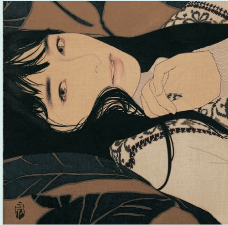
池永康晟《素顔・莉亜》2018年 亜麻布彩色 新見美術館寄託