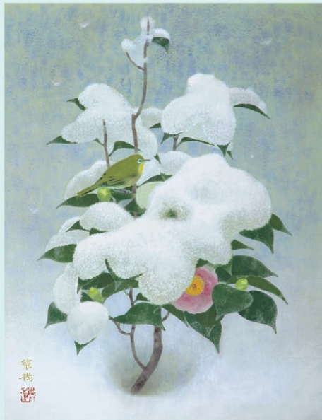
山口華楊《晨雪》1972年 紙本彩色