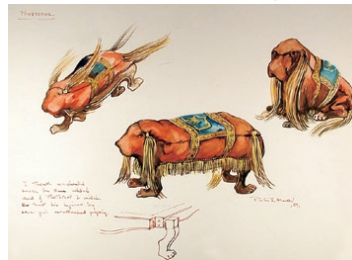
『美女と野獣』(1991年) フットスツール