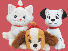
ぬいぐるみ マリー/レディ/ラッキー 各6,050円(税込)