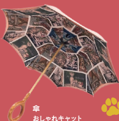
傘 おしゃれキャット 33,000円(税込)