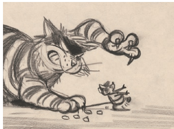
『シンデレラ』(1950年) ルシファー