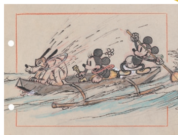
『ミッキーのハワイ旅行』(1937年) プルト