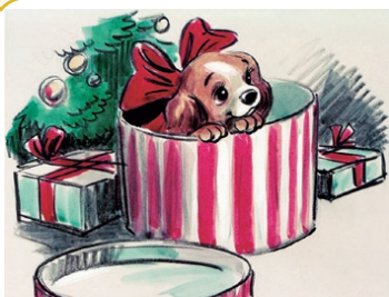
『わんわん物語』(1955年) レディ