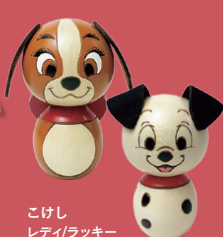
こけし レディ/ラッキー 各5,500円(税込)