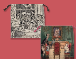
巾着 101匹わんちゃん/おしゃれキャット 各1,100円(税込)