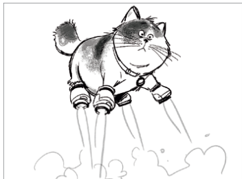
『ベイマックス』(2014年) モチ