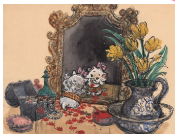
『おしゃれキャット』(1970年) マリー