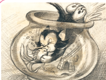
『ピノキオ』(1940年) フィガロ