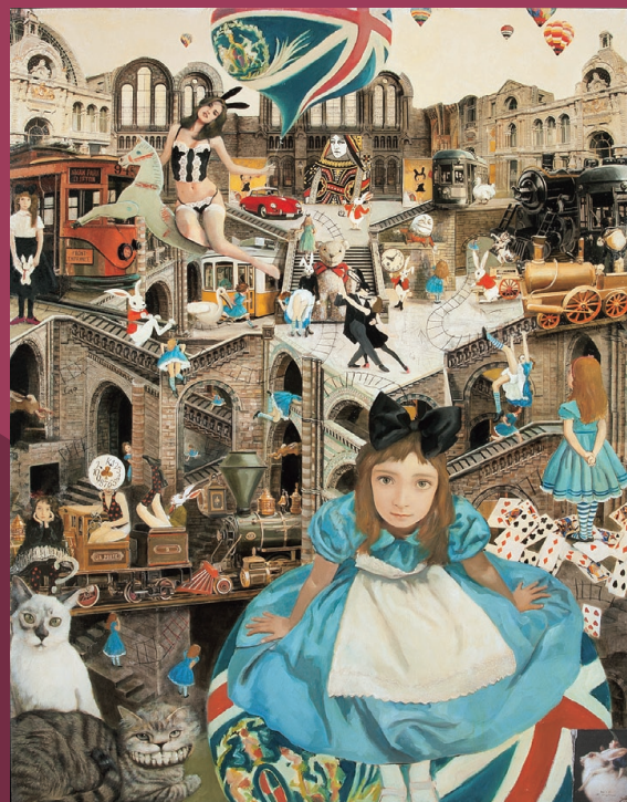
渡辺 栄一 《少年王国(アリス、君は誰なの?)》 2015年 油彩・紙 116.7×90.9cm 笠間日動美術館蔵

今回出品するパレットの中には絵が描かれたユニークなものが多数含まれていますので、画家の遊び心にも触れながら、その筆遣い、息遣いを作品とともに楽しみください。