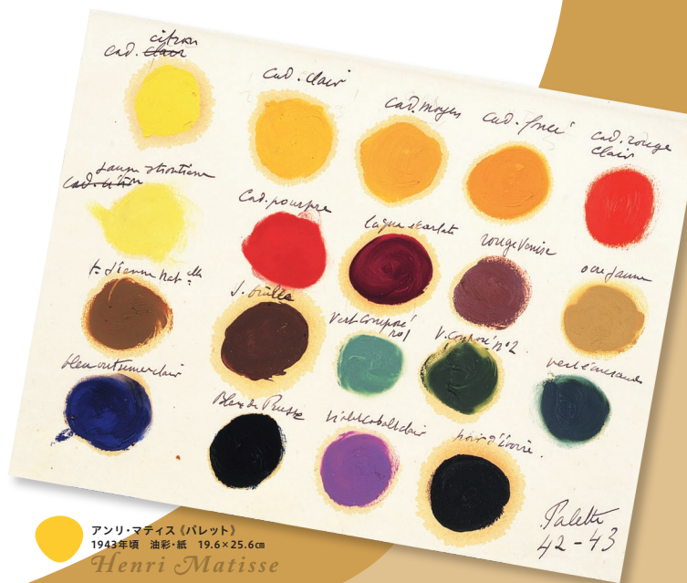
アンリ・マティス (パレット) 1943年頃 油彩・紙 19.6×25.6cm Henri Matisse