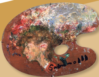
宮本三郎 (パレット) 油彩・板 24×34cm © Mineko Miyamoto 2024 / JAA2400157 Saburo Miyamoto