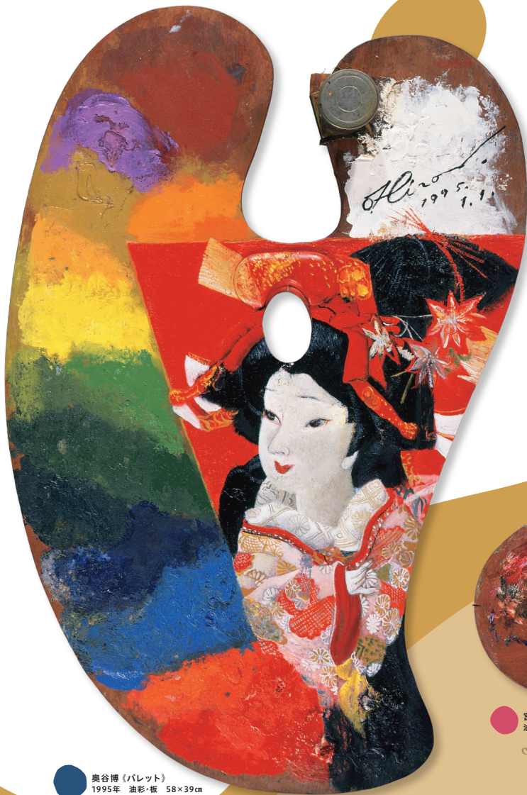
奥谷博 (パレット) 1995年 油彩・板 58×39cm Hiroshi Okutani