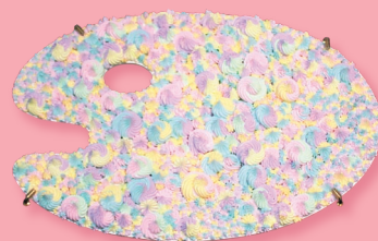
渡辺おさむ《クリームパレット》 2022年 モデリングペースト・アクリル絵具・板 20.2×30.5cm