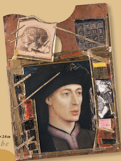
渡邊栄一 (パレット) 2005年 油彩・コラージュ・板 34×24cm Eiichi Watanabe