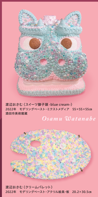
渡辺おさむ《スイーツ獅子頭-blue cream-》 2022年 モデリングペースト・ミクストメディア 55×55×55cm 酒田市美術館蔵