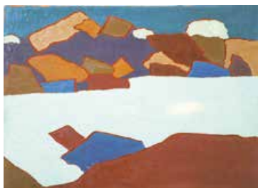
《五色沼》1956年頃 油彩画