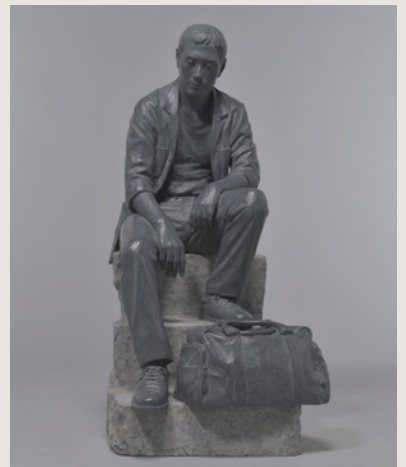
No.7 《旅の終りに》2021年