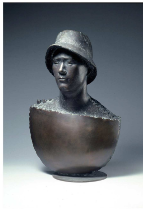
《旅・遺跡を巡る男》1997年