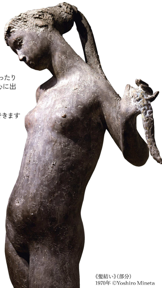
《髪結い》(部分) 1970年